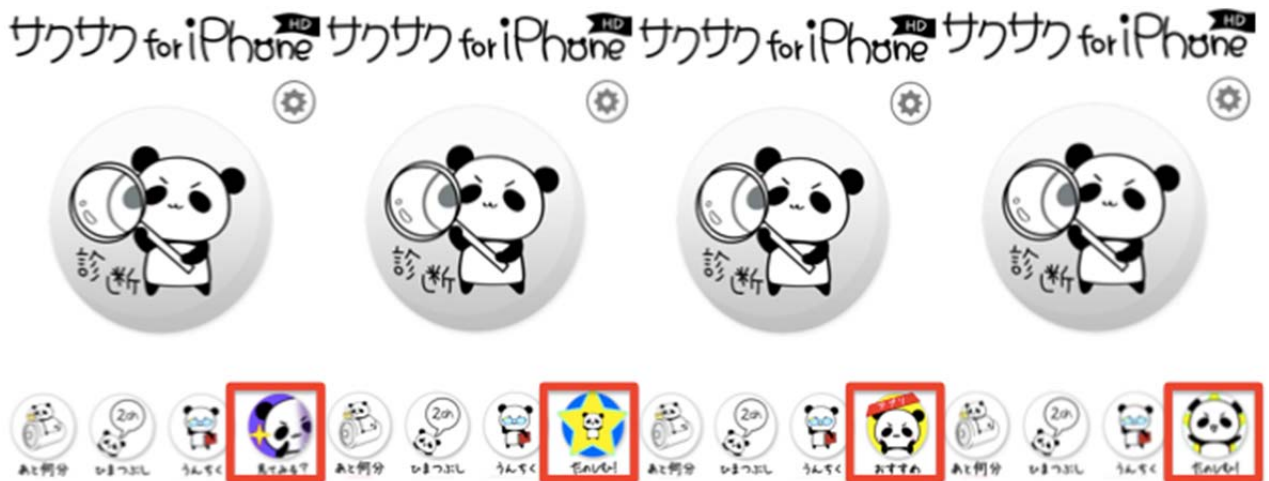
※ウォール型広告の誘導ボタン自動最適化配信機能における、Sample 画像

誘導ボタンのデザインを変更することにより、収益額が1.2倍～最大2倍以上向上する実績も出ております。本機能を活用いただくことで、ウォール型広告における収益性を飛躍的に向上させることが可能になります。なお、本機能の本リリースは2014年2月17日週を予定しております。